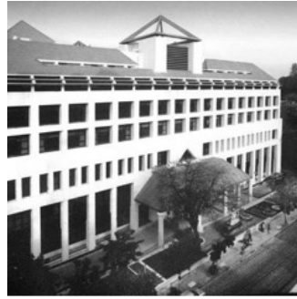
พิศุทธิ์ บุษยามา 26

จากสภาพเศรษฐกิจและสังคมในปัจจุบันที่มีความเร่งรีบและส่งผลให้วิถีของเรานั้นเปลี่ยนแปลงไป คงไม่มีใครที่ปฏิเสธว่าสิ่งต่างๆ เหล่านี้ส่งผลให้เรานั้นลืมให้ความสำคัญกับสุขภาพของตนเองทั้งสุขภาพกายและสุขภาพใจ แต่จะคิดหาไม้อ่ามีสถานที่ทำงานที่หนึ่ง ที่เห็นความสำคัญของพนักงานในองค์กรนั้นๆ โดยมองว่าสุขภาพกายที่ดีนั้นต้องควบคู่ไปกับสุขภาพใจที่ดีเช่นเดียวกัน สถานที่แห่งนี้คือโรงพยาบาลเอกชนแห่งแรกของประเทศไทย ที่คอยดูแลสุขภาพกายและสุขภาพใจของคนทีแวะเวียนเข้ามาอย่างยาวนาน "โรงพยาบาลบีเอ็นเอช" เปรียบเสมือนบ้านพยาบาลที่ดูแลสุขภาพของคุณ